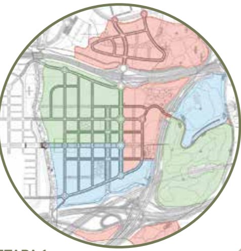
PLANO DE ETAPAS